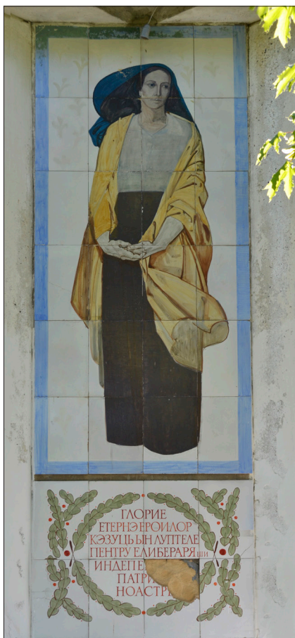
Ilie Bogdesco. Stela funerară din Ordășei, Telenești, 1984

Indiferent de diferențele de opinii trebuie să recunoaștem că în materie de ilustrare a cărții era un maestru desăvârșit. Un alt Bogdesco, cu siguranță, Moldova nu-l va mai avea în următoarea sută de ani.